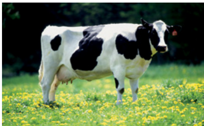
Modelo ideal de vaca leiteira (vaca holandesa)

A vaca leiteira ideal deve apresentar: boa associação entre alta produtividade e volume do úbere ; pescoço longo e descarnado com a cabeça fina; tamanho médio; ter grande volume abdominal e uma garupa larga e comprida; ser angular.