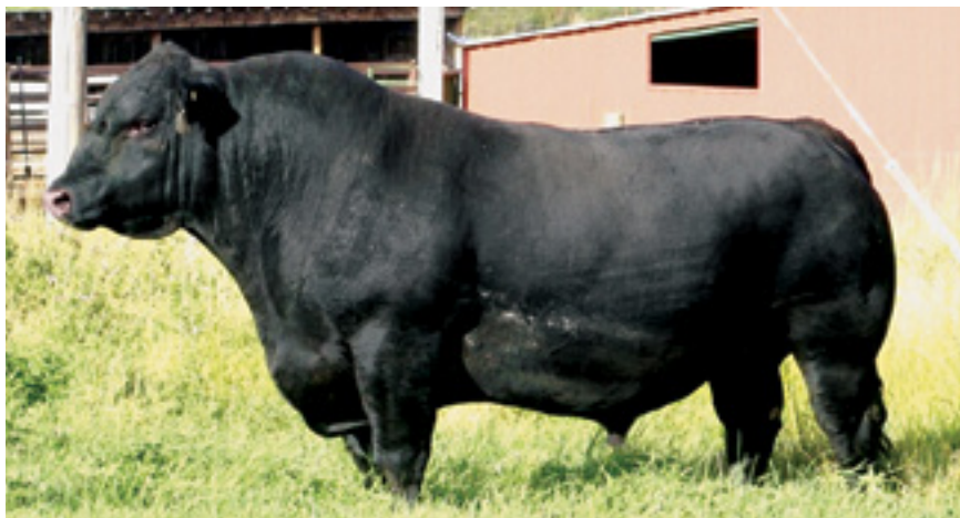
Touro Aberdeen Angus

Raça de origem escocesa, dentro dela encontram-se o Aberdeen, com sua pelagem negra, e o Red Angus, com suas pelagem vermelha e mocha. É um animal de porte pequeno e grau de musculatura moderado, com grande precocidade e bom acabamento. Possui boa longevidade e fertilidade, além de ter uma boa habilidade materna. É basicamente utilizado em cruzamentos maternos. Um exemplo clássico é o cruzamento Nelore com Aberdeen.