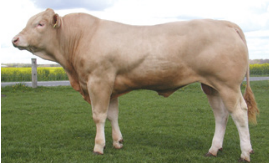
Touro Blonde D'aquitaine

É de origem francesa e possui uma pelagem de uma só cor, ligeiramente avermelhada até amarelada (cor de trigo). Apresenta carcaça de terminação precoce com boa rusticidade e facilidade no parto.