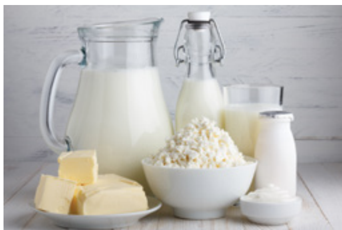
Leite e seus derivados

No Brasil, há indústrias multinacionais, controladas por capital externo, como a Nestlé, a Parmalat e a Danone. As indústrias nacionais, controladas por capital nacional, têm diferentes portes e um número bastante expressivo. Os principais exemplos são o Grupo Mansur (Vigor, Leco), Leitbom e Piracanjuba. Também temos outro tipo de indústrias, controladas por cooperativas de produtores de leite, como a Cooperativa Central dos Produtores Rurais de Minas Gerais, a Itambé e a Compleite.