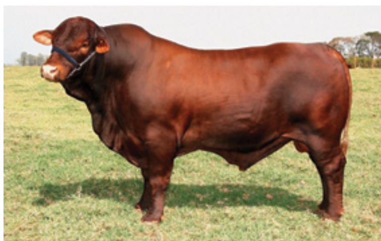
Touro Santa Gertrudes