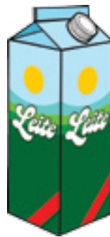
Figura 2 Leite