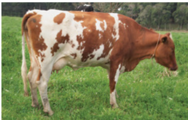
Vaca holandesa vermelha e branca

Essa raça tem sido amplamente utilizada em cruzamentos, sendo os principais: com o Gir, formando o Girolando; com o Guzerá, formando o Guzolando (ou Guzerando); com o Jersey, formando o Jersolando.