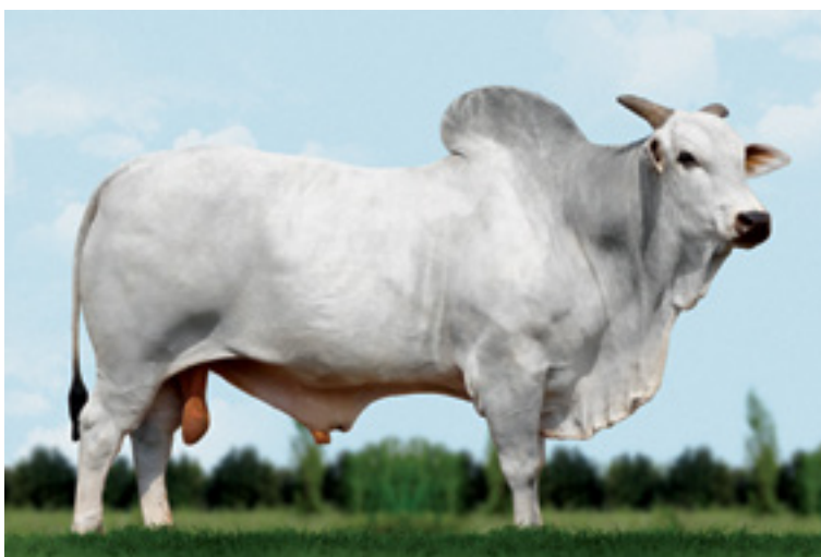
Touro Nelore Mocho

Em 1957 nasceu Caburey, o primeiro bezerro Nelore Mocho da história, em Araçatuba – São Paulo. O Nelore Mocho carrega as mesmas características da raça Nelore, com exceção do chifre, e surgiu no Brasil nas décadas de 40 e 50. Houve um grande interesse por parte dos criadores, pois a ausência do chifre é uma característica desejável. Os chifres podem oferecer perigos, seja pela agressão a outro animal do rebanho, seja em relação ao homem.