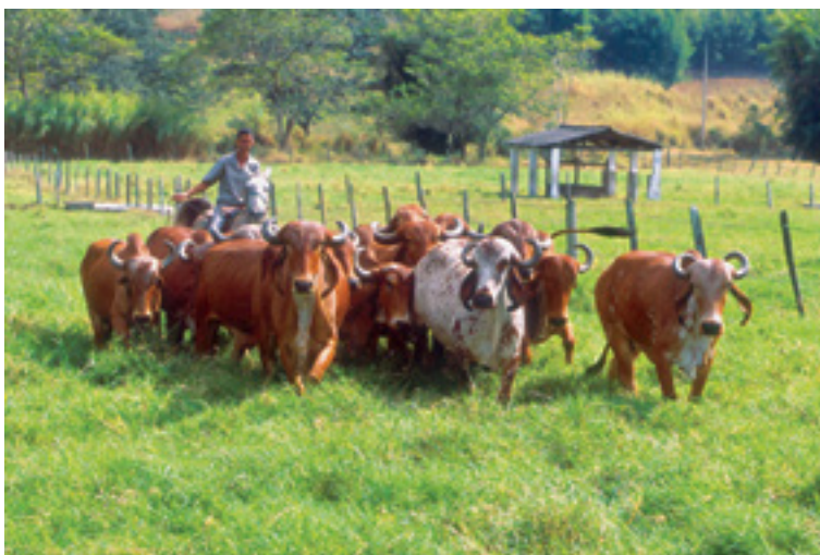
Rebanho de vacas Gir

O gir leiteiro tem sido bastante utilizado em cruzamentos, sendo preferido para cruzamentos com as raças europeias especializadas em leite (holandesa, jersey e pardo-suíço). Assim, é utilizada na formação do mestiço leiteiro brasileiro, conhecido como a raça Girolanda.