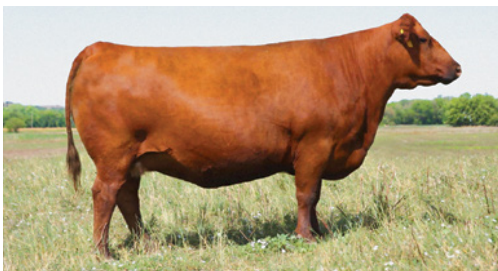
Touro Red Angus