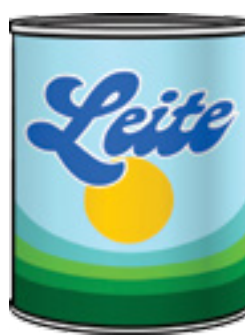
Figura 4 Leite em pó

O leite e seus derivados devem fazer parte da alimentação de crianças e adultos de todas as idades. São ricos em proteínas de alto valor biológico que beneficiam o crescimento e o desenvolvimento das crianças e dos adolescentes e que garantem um aporte proteico aos adultos. Devido à sua composição nutricional equilibrada e sua riqueza em cálcio, são indispensáveis em uma alimentação saudável. Para as crianças, os produtos lácteos ajudam no correto crescimento dos ossos e dos dentes e permitem a construção de reservas necessárias para o futuro. Durante a adolescência, o organismo precisa de mais cálcio para a maturação e o desenvolvimento da massa óssea. Uma ingestão insuficiente de cálcio nessa fase pode trazer problemas ósseos no futuro. Também é extremamente importante na idade adulta para prevenir e atrasar a perda de massa óssea, responsável pelo aparecimento da osteoporose e fraturas.