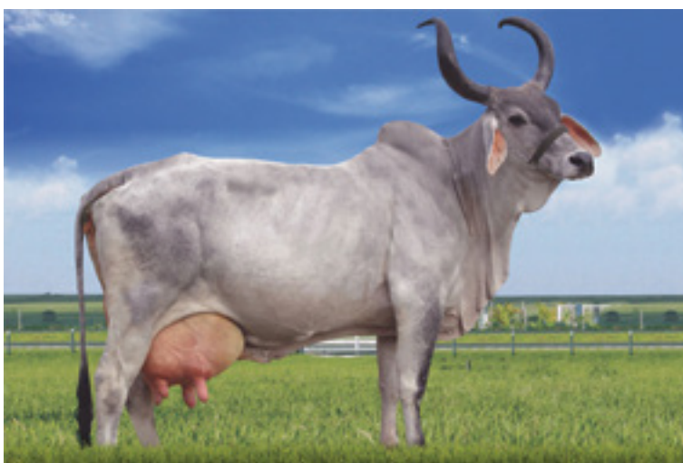
Vaca Guzerá leiteira

A origem dessa raça é a região central da Índia. Possui como características básicas de pelagem predominante a fumaça (cinza-prateado) com chifres em lira. Quanto à aptidão, é mista, ou seja, é uma raça de corte com linhagem leiteira. Possui uma produção média de 2.300 kg de leite por lactação com teor de gordura no leite de 3,5%.