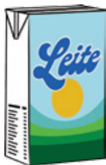
Figura 3 Leite UHT